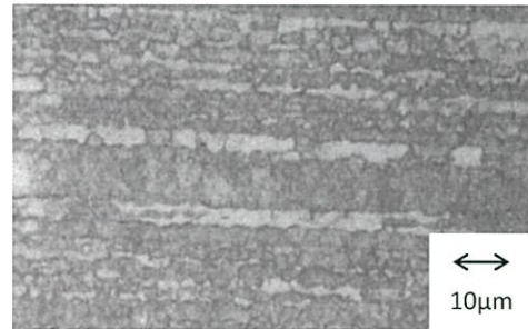
SUS329J3L 3.20mm 組織写真